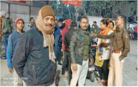
संवाददाता - अंबिकापुर, 20 नवम्बर 2022 (घटती-घटना)।

संयुक्त पुलिस द्वारा दो पहिया वाहनों के अमानक साइलेंसर एवं सार्वजनिक रूप से शराब पीने वालों पर ताबड़तोड़ कार्रवाई की जा रही है। संयुक्त टीम द्वारा शनिवार की शाम को शहर के घड़ी चौक, गांधी चौक, चौपाटी के आसपास संयुक्त पुलिस टीम द्वारा बुलेट मोटरसाइकिल के 14