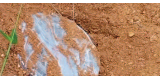
हदसा हो सकता था। सीआरपीएफ 231 वीं वाहिनी के जवान आज शनिवार को एरिया डोमिनेशन ड्यूटी पर कमलपोस्ट से नाकाम कर दिया है। फोर्स को निशाना बनाने के लिए नक्सलियों ने एक बड़ा आईईडी प्लांट किया था लेकिन सीआरपीएफके जवानों ने उसे निष्क्रिय कर दिया, नहीं तो फिर से एक बड़ा

कोण्डासावली, 19 नवम्बर 2022 (ए)। छत्तीसगढ़ में तैनात सीआरपीएफ के जवानों ने एक बार फिर नक्सलियों के नापक मंसुबों को नाकाम कर दिया है। फोर्स को निशाना बनाने के लिए नक्सलियों ने एक बड़ा आईईडी प्लांट किया था लेकिन सीआरपीएफके जवानों ने उसे निष्क्रिय कर दिया, नहीं तो फिर से एक बड़ा