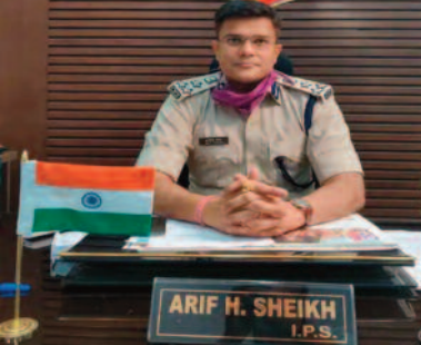
आईजी आरिफ एच.शेख को छोड़कर रेंज के 4 जिलों का अधिकार दिया गया है और आईजी गुणवार्ता अजय यादव को रायपुर जिला का। ऐसे में अब तक रायपुर आईजी रेंज कार्यालय शंकर नगर में किसका अधिकार होगा यह स्पष्ट नहीं किया गया है। वैसे ही अब तक रायपुर रेंज के तहत महासमुंद, धमतरी, गरियाबंद

और बलौदा बाजार-भाटापारा समेत रायपुर जिला के लिए सेटअप और मैन पावर भी किस तरह से होगा यह चर्चा का विषय है। आमतौर पर आईजी रायपुर जिला अजय यादव से अगर पुलिस कार्रवाई या न्याय की आस लेकर पीड़ित मुलाकाती क्या गुणवार्ता दफतर जायेंगे। आईजी रायपुर को क्या अलग से स्टाफ मिलेगा और रायपुर रेंज के 4 जिला देखने वाले आईजी आरिफ एच शेख को अतिरिक्त स्टाफ या पुराना स्टाफ में बंटवारा करना होगा? क्योंकि आईजी शेख के पास न्याय की आस लेकर 4 जिलों से लोग आएंगे।