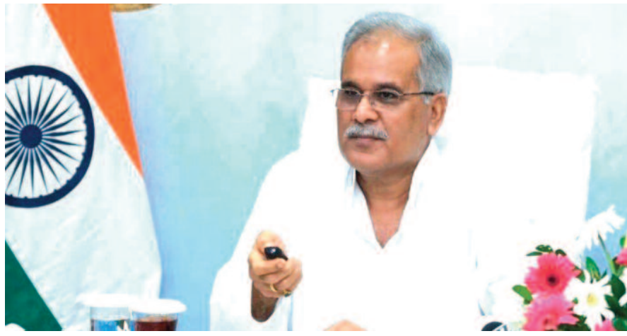
किसानों का पंजीयन हुआ है, जिसमें लगभग 2.18 लाख नये किसान हैं। राज्य में धान खरीदी के लिए 2538 उपार्जन केन्द्र बनाए गए हैं। इस साल किसानों से सामान्य धान 2040 रूपए प्रति

साथ-साथ लगातार कस्टम मिलिंग के लिए धान का उठाव भी चल रहा है। खाद्य विभाग से प्राप्त जानकारी के अनुसार 1 नवंबर से चालू धान खरीदी सीजन में अब तक लगभग 2 लाख 61 हजार 346 किसानों से 8 लाख 67 हजार 487 मीट्रिक टन धान की खरीदी हुई है। धान के एवज में किसानों को बैंक लिकिंग व्यवस्था के तहत 1777.59 करोड़ रुपये का भुगतान जारी कर दिया गया है। गौरतलब है कि राज्य सरकार द्वारा इस वर्ष 110 लाख मीट्रिक टन धान का उपार्जन अनुमानित है। समर्थन मूल्य पर धान बेचने के लिए प्रदेश में 25.91 लाख