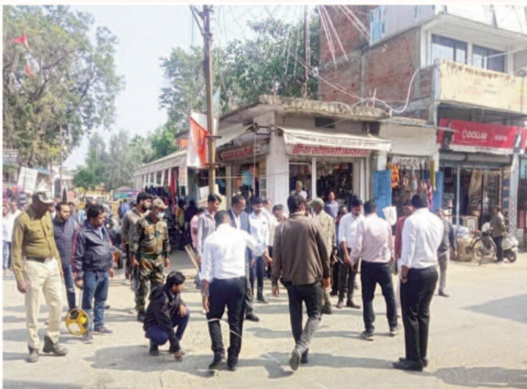
समझ से परे है।

उल्लेखनीय है कि कोरिया जिला मुख्यालय में इन दिनों व्यापार जगत में काफी निराशा देखने को मिल रही है, जिला विभाजन और दूसरी ओर बाईपास सड़क बन जाने के बाद से शहर में लोगों की आवाजाही काफी कम हो गई है, तो वहीं सड़क चौड़ीकरण न होने से स्थानीय लोगों को भी अपनी चारपहिया वाहन लेकर बाजार आने जाने में काफी दिक्कत का सामना करना पड़ता है, स्थानीय नागरिक बाजार आने जाने में खुद को काफी असहज महसूस करते हैं। सभी का मानना है कि समय के साथ-साथ शहर में चाहरपहिया वाहन बहुत संख्या में बढ़े हैं उस हिसाब से सड़क चौड़ीकरण किया जाना अत्यंत आवश्यक है। सड़क चौड़ीकरण न होने से आए दिन जाम की स्थिति निर्मित होती है। किसी भी धार्मिक, राजनैतिक आयोजन में बड़ी संख्या में लोगों का आना जाना शहर में होता है, जिससे कि घंटों जाम की स्थिति निर्मित होती है जिसका नुकसान प्रत्यक्ष तौर पर स्थानीय व्यापारियों को उठाना पड़ता है। आयोजन के समय व्यापार एकदम चौपट होने से व्यापारी वर्ग खासा परेशान रहते हैं। लेकिन इस ओर शासन प्रशासन की चुप्पी