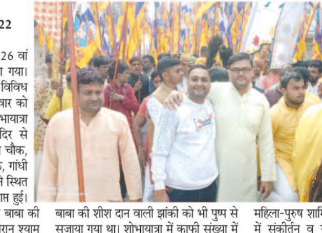
बाबा की शोभा दान वाली झांकी को भी पुष्प से सजाया गया था। शोभायात्रा में काफी संख्या में महिला-पुरुष शामिल हुए। रात को श्याम मंदिर में संकीर्तन व जागरण का आयोजन किया गया। कार्यक्रम देर रात तक चलता रहा। जीतने वाले के सब साध... ये हारे का सहारा... ऐसा श्याम हमारा... जो जितनी दूरी से लेकर आया...उसने उतने नजदीक से दर्शन सहित अन्य श्याम के आकर्षक संगीत पर श्रद्धालु झूमते नजर आए। शोभायात्रा का लोगों ने जगह-जगह पुष्प वर्षा कर स्वागत किया। श्याम सेवा मंडल द्वारा पीजी कॉलेज के सामने स्थित श्याम मंदिर में शोभायात्रा के बाद शाम को खाट्वाले श्याम बाबा का फूलों से अलौकिक श्रृंगार किया गया। इस अवसर पर महाआरती भी की गई। इसके बाद श्याम बाबा की 56 भोग व सवामणि भोग व अमृतमय महाप्रसाद का भोग अर्पित किया गया।

खाट्वाले श्याम बाबा मंदिर का 26 वां वार्षिक महोत्सव धूमधाम से मनाया गया। श्याम सेवा मंडल द्वारा 4 दिनों तक विविध कार्यक्रम आयोजित किए गए। सोमवार को राम मंदिर से नगर में भव्य शोभायात्रा निकाली गई। शोभा यात्रा राम मंदिर से निकलकर जय स्तंभ चौक, महामाया चौक, संगम चौक, देवीगंज रोड, घड़ी चौक, गांधी चौक होते हुए पीजी कॉलेज के सामने स्थित श्यामबाबा के मंदिर में पहुंचकर समाप्त हुई। शोभायात्रा के दौरान खाट्वाले श्याम बाबा की आकर्षक झांकी निकाली गई। इस दौरान श्याम