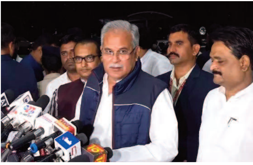
रायपुर, 07 नवम्बर 2022। आरक्षण के मसले पर छिड़ी बयानबाजी पर अब सीएम भूपेश

» सीएम भूपेश बघेल ने कहा-भाजपा के कारण आदिवासियों का आरक्षण 20 प्रतिशत हुआ, उसे हमारी सरकार ठीक करेगी