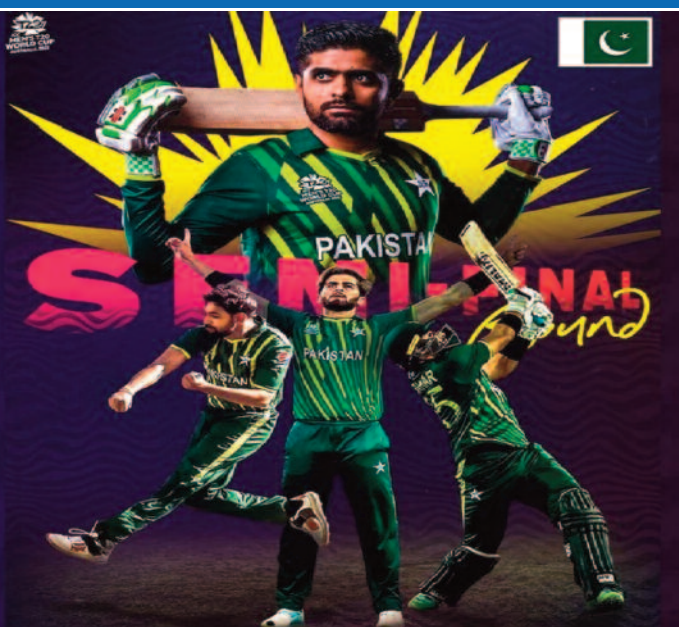
लिये 47 गेंद में 72 रन की साझेदारी निभाकर बांग्लादेश के लिये अच्छी नींव रखी। इस समय ऐसा लग रहा

न ज मु ल हुसैन शांटी ने 48 गेंद में 54 रन की पारी खेली लेकिन बांग्लादेश की टीम अंत में रन नहीं जुटा सकी जिसमें अफरीदी के बाद पाकिस्तानी स्पिनरों ने विकेट ड्राईट की। लिटन दास के जल्दी आउट होने के बाद शांटी और सोम्य सरकार (20 रन, 17 गेंद, एक चौका, एक छक्का) ने दूसरे विकेट के