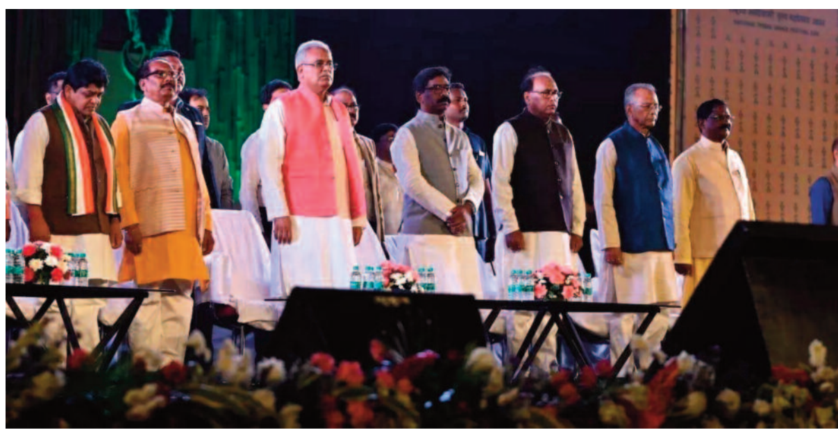
और बुजुर्ग सब शामिल हैं। 70 साल की बुजुर्ग महिलाएं भी फुगड़ी खेल रही हैं। सबको बचपन की यादें ताजा हो गई हैं। इन खेलों से मोबाइल से ध्यान हटा, यह भी बड़ी बात है। इस मौके पर अपने संबोधन में झारखंड के मुख्यमंत्री श्री हेमंत सोरेन ने कहा कि मुख्यमंत्री श्री बघेल छत्तीसगढ़ में ऐसे वर्ग को आगे बढ़ा रहे हैं जिनका सदियों से शोषण हुआ है। उनकी सरकार आदिवासी, दलित और पिछड़े लोगों को आगे बढ़ाने के साथ ही सबके विकास के लिए कार्य कर रही है। मुझे इस मंच में आकर गौरव महसूस हो रहा है। इस मौके पर झारखंड के मुख्यमंत्री

माध्यम से प्रकृति और लोकजीवन को सहेजने के सुंदर मूल्य जो सीखने को मिलते हैं वो सीख हमारे लिए अमूल्य है। मुख्यमंत्री ने कहा कि हमने शिल्प कला को बढ़ावा देने के उद्देश्य से स्टाल भी लगाए। इनमें बड़ी संख्या में लोगों की भीड़ जुटी, उससे पता लगता है कि हमारी आदिवासी कला को जानने के लिए लोग कितने उत्सुक हैं और यह कितनी समृद्ध लोककला है। मुख्यमंत्री ने इस मौके पर कहा कि हम 22 साल से स्थापना दिवस मना रहे हैं। अब राष्ट्रीय आदिवासी नृत्य महोत्सव भी मना रहे हैं। इससे हमारी खुशी दोगुनी हो गई है। मुख्यमंत्री ने इस अवसर पर शिरकत करने पहुंचे झारखंड के मुख्यमंत्री श्री हेमंत सोरेन के प्रति भी विशेष रूप से आभार व्यक्त किया। मुख्यमंत्री ने कहा कि इस महोत्सव के आयोजन के साथ ही हम प्रदेश में छत्तीसगढ़िया ओलंपिक का आयोजन भी कर रहे हैं। इसमें 20 लाख प्रतिभागियों ने अब तक हिस्सा लिया है। इसमें बच्चे