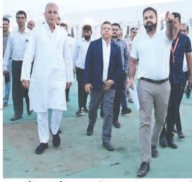
है। इस दौरान 1 से 3 नवंबर तक राष्ट्रीय आदिवासी नृत्य महोत्सव का आयोजन साइंस कालेज मैदान में किया जा रहा है। मुख्यमंत्री श्री भूपेश बघेल गुरुवार की शाम महोत्सव की तैयारियों का जायजा लेने के लिए साइंस कालेज मैदान पहुंचे। मुख्यमंत्री श्री भूपेश बघेल गुरुवार की शाम महोत्सव की तैयारियों का जायजा लेने के लिए साइंस कालेज मैदान पहुंचे। मुख्यमंत्री श्री भूपेश बघेल गुरुवार की शाम महोत्सव की तैयारियों का जायजा लेने के लिए साइंस कालेज मैदान पहुंचे।