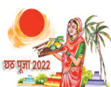
छठ पूजा का पहला अर्घ्य-छठ पूजा के तीसरे दिन सूर्यास्त के समय डूबते सूर्य को अर्घ्य देने का विधान है। व्रती महिलाएं या पुरुष पानी में खड़े होकर अर्घ्य देते हैं। इस दिन सूर्यास्त का समय शाम 05 बजकर 37 मिनट है।

नई दिल्ली, 27 अक्टूबर 2022। भगवान सूर्य व छठी माता को समर्पित छठ पर्व हर साल कार्तिक मास के शुक्ल पक्ष की षष्ठी तिथि को मनाया जाता है। इस साल ये 28 अक्टूबर से शुरू होकर 31 अक्टूबर तक चलेगा। यह पर्व चार दिन तक चलता है। छठ पूजा में संतान के स्वास्थ्य, सफलता व दीर्घायु के लिए पूरे 36 घंटे का निर्जला व्रत रखा जाता है। इस व्रत को महिलाओं के साथ पुरुष भी रखते हैं।