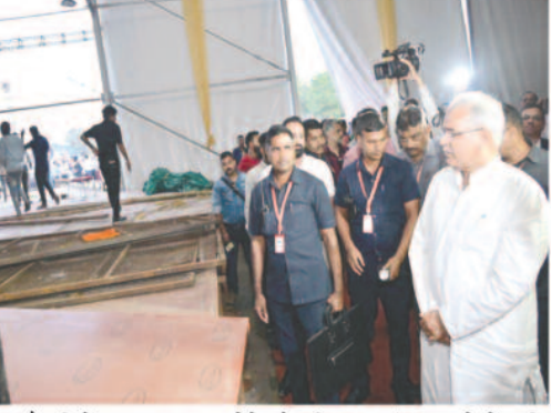
प्रदेशों सहित 09 देशों के 1500 आदिवासी कलाकार अपनी प्रस्तुति देने के लिए छत्तीसगढ़ आ रहे हैं। इस अवसर पर सभी विभागों के वरिष्ठ अधिकारी उपस्थित थे।

किया और विभागीय अधिकारियों को तैयारियों को के संबंध में आवश्यक दिशा निर्देश भी दिए। गौरतलब है कि 1 से 3 नवंबर तक आयोजित राज्योंसव एवं राष्ट्रीय आदिवासी नृत्य महोत्सव को भव्य रूप से मनाने की तैयारी की जा रही है और इसके लिए साइंस कालेज मैदान में तैयारियां ज़ोरों पर हैं। राष्ट्रीय आदिवासी नृत्य महोत्सव के लिए सभी राज्यों, केंद्र शासित प्रदेशों सहित 09 देशों के 1500 आदिवासी कलाकार अपनी प्रस्तुति देने के लिए छत्तीसगढ़ आ रहे हैं। इस अवसर पर सभी विभागों के वरिष्ठ अधिकारी उपस्थित थे।