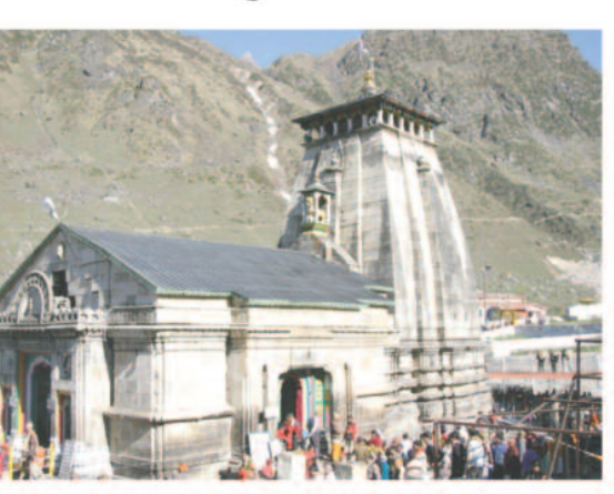
विधिविधान के साथ मंदिर के मुख्य कपाट के साथ ही पीछे के कपाट को बंद कर सील कर दिया गया। धाम से बाबा की चल विग्रह डोली अपने शीतकालीन स्थान के लिए

रुद्रप्रयाग, 27 अक्टूबर 2022। विश्व प्रसिद्ध धाम केदारनाथ के कपाट भाईदूज यानी आज शीतकाल के लिए बंद कर दिए गए। आगामी छह माह की पूजा अर्चना एवं भोले बाबा के दर्शन ऑंकारेश्वर मंदिर ऊखीमठ में होंगे। आज ही यमुनोत्री धाम के कपाट भी दोपहर 12:00 बजे बंद कर दिए जाएंगे। एक दिन पहले गंगोत्री धाम के कपाट भी बंद कर दिए गए थे। वहीं, बदरीनाथ धाम के कपाट 19 नवंबर को बंद होंगे। गुरुवार को सुबह चार बजे से केदारनाथ धाम में भगवान का अभिषेक किया गया। जिसके बाद उन्हें समाधि दी गई। भगवान केदार की डोली मंदिर के बाहर आई और भक्तों ने भव्य दर्शन दिए। इसके बाद पौराणिक