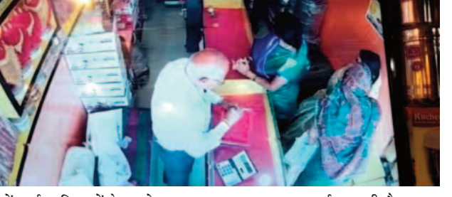
में आई। महिलाओं के कहने पर दुकान संचालक लौकेट दिखाने लगा। इस दौरान महिलाएं कुछ सामान खरीदीं और मौका पाकर तीन सोने की लौकेट चोरी कर निकल गईं। महिलाओं को वापस जाने पर दुकान संचालक जब अपना सामान समेटने लगा तो पता चला की तीन लौकेट गायब है। इसे देख उसके होश उड़ गए। तीन सोने की लौकेट की कीमत लगभग डेढ़