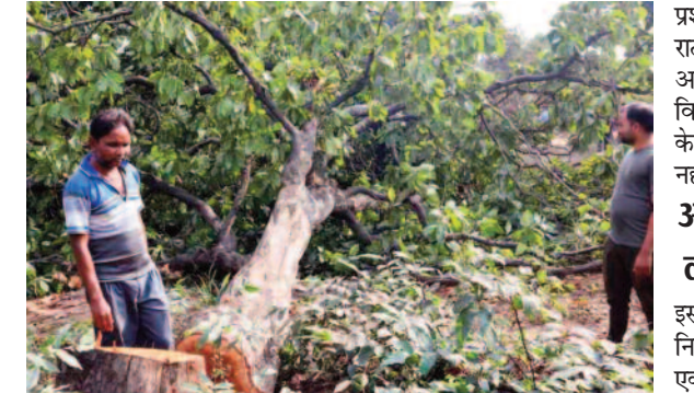
आईसीएफआईआई की रिपोर्ट दो भाग में है जिसमें भाग दो डब्ल्यूआईआई द्वारा प्रस्तुत रिपोर्ट है जो वन्य प्राणी आदि प्रश्नों पर प्राथमिकता से राय देती है। आज यह रिपोर्ट्स प्रस्तुत ना होने के कारण केंद्र सरकार की ओर से सॉलिसिटर जनरल तुषार मेहता ने मामले में समय की

अगली सुनवाई 13 नवम्बर के बाद —संवाददाता— अंबिकापुर, 19 अक्टूबर 2022 (घटती-घटना)। सुप्रीम कोर्ट में हस्तक्षेप अरण्य क्षेत्र को राजस्थान विद्युत् निगम को आवंटित खदानों की वन अनुमति को चुनौती देने वाले मामले में राजस्थान विद्युत् निगम और सरकार ने सुप्रीम कोर्ट से कहा कि अगली सुनवाई तक कोई पेड़ कटाई नहीं की जायेगी। इस कथन के बाद कोर्ट ने सुनवाई की तिथि आगे बढ़ाने का निवेदन स्वीकार कर लिया। गौरतलब है कि 13 अक्टूबर को सुप्रीम कोर्ट ने इस मामले में आईसीएफआईआई द्वारा दस्तक सरकार को प्रस्तुत सारी रिपोर्ट्स अगली सुनवाई तक प्रस्तुत करने का आदेश दिया था।