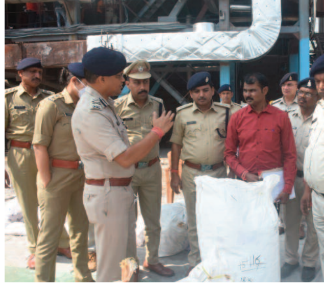
जस की गई थी। पुलिस द्वारा पकड़े गए नशे के जखरों का नष्टीकरण किया गया। अभियान के तहत सरगुजा रेंज में 201 प्रकरणों में 47 क्विंटल 33 किलो गांजा, 30.44 ग्राम बाराउन शुगर, 2390 नग सिरप, 13376 नग केस्पूल,