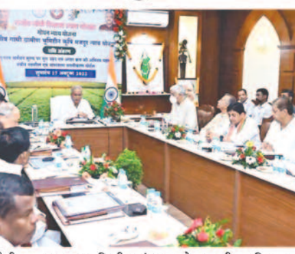
व्यवस्था निजी संस्था को करनी होगी। योजना के तहत विश्वविद्यालय अनुदान आयोग से गुणवत्ता रेटिंग संस्था राष्ट्रीय मूल्यांकन एवं

सरकार कॉलेज की स्थापना व्यय का अधिकतम दो करोड़ रुपए का 20% पिछड़ा क्षेत्रों के लिए और 30% अति पिछड़ा क्षेत्रों में अनुदान के रूप में देगी। कॉलेज के सभी विद्यार्थियों को सरकारी छात्रवृत्ति भी मिलेगी। लेकिन कॉलेज के समस्त शैक्षणिक स्टाफ एवं कर्मचारियों की वेतन