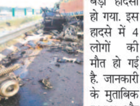
कंटेनर और वीएमडब्ल्यू में टक्कर, मची चीख-पुकार

सुल्तानपुर, 14 अक्टूबर 2022। उत्तर प्रदेश के सुल्तानपुर में शुक्रवार को बड़ा हादसा हो गया। इस हादसे में 4 लोगों की मौत हो गई है। जानकारी के मुताबिक BMW और कंटेनर में भिड़ंत हुई है। हादसे में कार सवार 4 लोगों की मौत हुई है। दरअसल, पूर्वांचल एक्सप्रेस-वे पर पिछले दिनों सड़क धंसी गई थी। इसके बाद से एक ही तरफ से गाड़ियों का आवागमन हो रहा था। बताया जा रहा है।