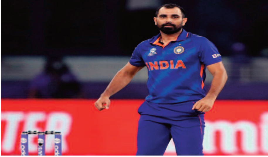
शमी ऑस्ट्रेलिया पहुंच गए हैं और अभ्यास मैचों से पहले ब्रिस्बेन में टीम के साथ जुड़ेंगे। इसके साथ ही

नई दिल्ली, 14 अक्टूबर 2022। टी20 विश्व कप को लेकर टीम इंडिया लगातार अपनी तैयारी कर रही है। टीम इंडिया को अपना पहला मुकाबला पाकिस्तान के खिलाफ 23 अक्टूबर को मेलबर्न क्रिकेट ग्राउंड में खेला जाएगा। इन सबके बीच भारत को सबसे बड़ा झटका लगा था जसप्रीत बुमराह चोट की वजह से टी 20 विश्व कप से बाहर हो गए थे। अब टी20 विश्वकप में जसप्रीत बुमराह की जगह मोहम्मद शमी को रखा गया है। इसके लेकर बीसीसीआई की ओर से आधिकारिक ऐलान भी कर दिया गया है। जय शाह की ओर से जारी एक बयान में लिखा गया है कि अखिल भारतीय वरिष्ठ चयन समिति ने मोहम्मद शमी को भारत के आईसीसी पुरुष टी 20 विश्व कप टीम में जसप्रीत बुमराह के प्रतिस्थापन के रूप में नामित किया है। इसके आगे बताया गया है कि