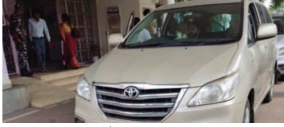
विभाग को सील कर अफसरों को बिठाकर फाइलों की जांच शुरू कर