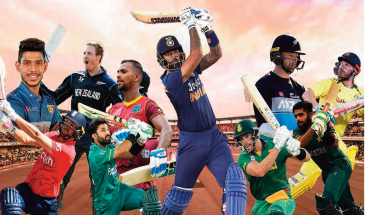
मेलबर्न, 14 अक्टूबर 2022। ऑस्ट्रेलिया में खेले जा रहे इस टूर्नामेंट के मुकाबले कुल 7 मैदानों में खेले जाएंगे। एडिलेड के एडिलेड

ओवल, ब्रिसबेन के द गाबा, गैलीग के कार्डिनिया पार्क, होबार्ट के बेलेरिव ओवल, पर्थ के द पर्थ स्टेडियम, मेलबर्न के मेलबर्न क्रिकेट ग्राउंड और सिडनी के सिडनी क्रिकेट ग्राउंड में खेले जाएंगे।