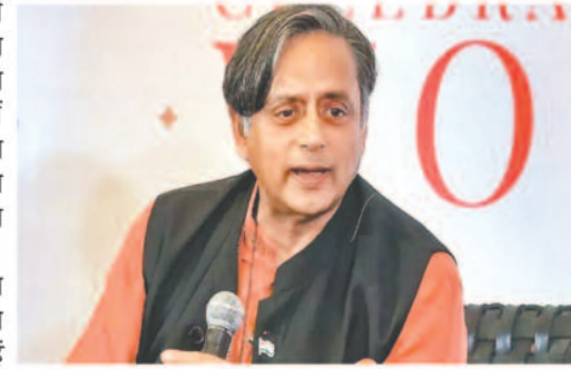
थरूर ने चुनाव से जुड़े जरूरी कागजात देने में भी नेताओं पर भेदभाव का आरोप लगाया है। उन्होंने कहा कि थरूर ने कहा- मैंने राज्य कांग्रेस कमेटी का दौरा किया, लेकिन वहां राज्य प्रमुख उपलब्ध नहीं थे। मैं शिकायत नहीं कर रहा हूँ, लेकिन क्या आपको व्यवहार में अंतर नहीं दिखता है?