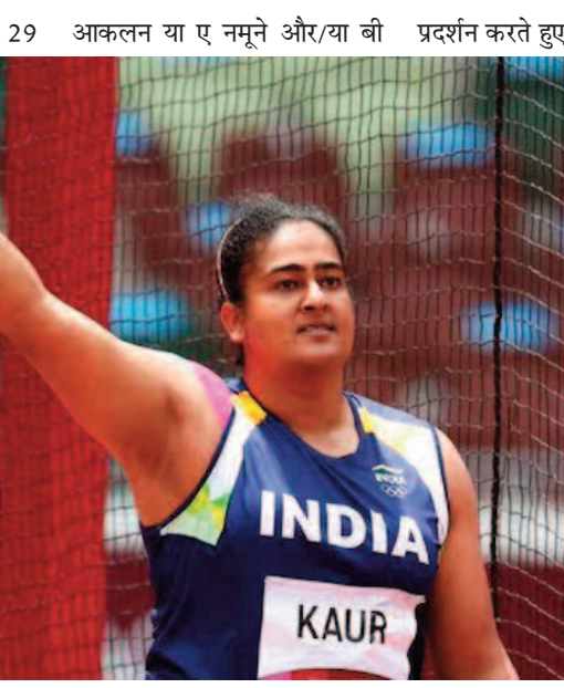
किसी भारतीय खिलाड़ी का फील्ड स्पॉर्जों में तीसरा सर्वश्रेष्ठ प्रदर्शन था। छब्बीस साल की कमलप्रीत ने निजी प्रयोगशाला में चार सप्लीमेंट

मौजूदगी/इस्तेमाल करने पर 29 आकलन या ए नमूने और/या बी प्रदर्शन करते हुए छुटे स्थान पर रहीं थी। उन्होंने पिछले साल तोक्यो खेलों से पहले 65.06 मीटर दूर चक्का फेंक राष्ट्रीय रिकॉर्ड बनाया था। उन्होंने तोक्यो खेलों के दौरान 63.70 मीटर के सर्वश्रेष्ठ प्रयास के साथ सातवें स्थान पर रहीं थी। यह नमूने के प्रयोगशाली दस्तावेजीकरण पैकेज की मांग नहीं करेगी।' कमलप्रीत तोक्यो खेलों में शानदार