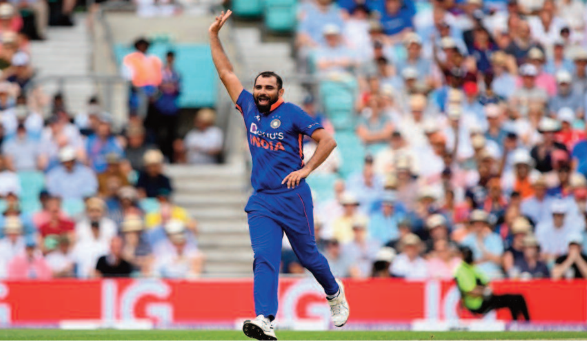
शमी पहले स्टैंडबाय खिलाड़ी के रूप में टीम के साथ थे। हालांकि, अब उन्हें 15 में शामिल किया जा सकता है। मोहम्मद शमी लिमिटेड ओवर क्रिकेट में कम ही खेलते हैं। लेकिन जिस तरीके से आईपीएल में गुजरत टाइम्स की ओर से उन्होंने प्रदर्शन किया था, उसके बाद से उनकी दावेदारी काफी

नई दिल्ली, 13 अक्टूबर 2022। भारत के स्टार गेंदबाज मोहम्मद शमी ऑस्ट्रेलिया के लिए रवाना हो चुके हैं। मोहम्मद शमी के साथ मोहम्मद सिराज और शार्दूल ठाकुर भी ऑस्ट्रेलिया के लिए रवाना हुए हैं। जानकारी के मुताबिक मोहम्मद शमी जल्द ही टीम इंडिया से जुड़ जाएंगे। ऐसे में माना जा रहा है कि मोहम्मद शमी को जसप्रीत बुमराह के जगह भारतीय टीम में शामिल किया जा सकता है। आपको बता दें कि टी 20 विश्व कप से ठीक पहले जसप्रीत बुमराह चोटिल हो गए हैं। जिसकी वजह से उन्हें टीम से बाहर होना पड़ा है। जसप्रीत बुमराह के जगह किस टीम में शामिल किया जाएगा, इसको लेकर बीसीसीआई की ओर से फइनल निर्णय नहीं लिया गया है। इसके अलावा स्टैंडबाय खिलाड़ी के रूप में टीम में शामिल उपेक चाहर भी चोटिल हो गए हैं जिसकी वजह से उन्हें भी बाहर होना पड़ा है। दीपक चाहर के चोटिल होने की वजह से सिराज और शार्दूल ठाकुर को ऑस्ट्रेलिया भेजा जा रहा है। मोहम्मद