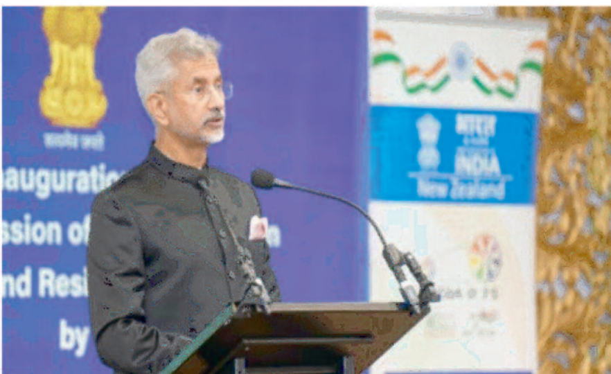
विदेश मंत्री ने अपने संबोधन में बोले हुए कोरोना, जलवायु परिवर्तन जैसी प्रमुख चुनौतियों पर चर्चा की।

ग्वाटेमाला सिटी, 11 अक्टूबर 2022। ग्वाटेमाला के राष्ट्रपति एलेजांद्रो जियामार्टेई ने उष्णकटिबंधीय तूफान 'जूलिया' से हुई क्षति के मद्देनजर इसे राष्ट्रीय आपदा घोषित कर दिया है। जियामार्टेई ने सोशल मीडिया पर कहा कि कैबिनेट की बैठक के दौरान लिए गए निर्णय को अनुमोदन के लिए कांग्रेस को भेजा जाएगा। उन्होंने कहा, जूलिया के कारण मध्य अमेरिका और ग्वाटेमाला में बहुत अधिक नुकसान हुआ है। भारी से बहुत बारिश के आसार हैं और पहले से ही बाढ़ आ चुकी है। लोग बाढ़ में फंसे हुए हैं। कई पुल प्रभावित हुए हैं। सड़कें क्षतिग्रस्त हुई हैं और लोग बिना बिजली के हैं। उन्होंने कहा कि अगले 48 से 72 घंटों में बाढ़ में बढ़ोतरी होने की प्रबल आशंका है।