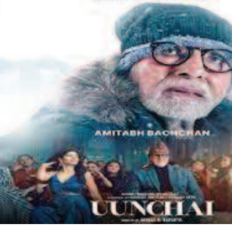
फैंस हार्ट इमोजी के साथ फिल्म के पोस्टर पर अपनी प्रतिक्रियाएं दे रहे हैं। इस पोस्टर में एक जगह लिखा गया है,

दोस्ती ही उनकी एकमात्र प्रेरणा थी। इस फिल्म का पहला पोस्टर फ्रेंडशिप डे पर जारी किया गया था, जिसमें अमिताभ के साथ अनुपम खेर और बोमन ईरानी को पहाड़ पर चढ़ते हुए दिखाया गया था। ऊंचाई में अभिनेत्री परिणीति चोपड़ा भी मुख्य भूमिका में नजर आएंगी। खबरों की मानें तो फिल्म में परिणीति को टूरिस्ट गाइड की भूमिका में देखा जाएगा। उनके अलावा डेनी डेनजोंगा, सारिका ठाकुर और नीना गुप्ता जैसे सितारे भी इस फिल्म का हिस्सा हैं। फिल्म की शूटिंग इस साल की शुरुआत में पूरी हो गई थी। इस फिल्म को मुंबई, नेपाल, लखनऊ, आगरा और कानपुर जैसी जगहों पर शूट किया गया है। यह एक फेमिली ड्रामा एंटरटेनर फिल्म होगी।