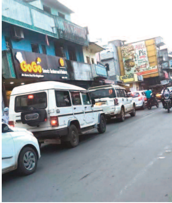
राविसिंह-बैकुण्ठपुर 19 सितम्बर 2022 (घटती-घटना)।

बोते रविवार को शिक्षक पात्रता परीक्षा खत्म होते ही जिला मुख्यालय के मुख्य सड़क में घंटो जाम लगा रहा, सामाजिक बाजार के दिन लगे जाम के बाद यातायात विभाग के कार्यों को जाम खत्म करने काफी मशकत करनी पड़ी तो वहीं इससे व्यापार भी घंटो चौपट रहा। काफी देर तक अफरा-तफरा का माहौल बना रहा तो कई लोग अपने गंतव्य तक