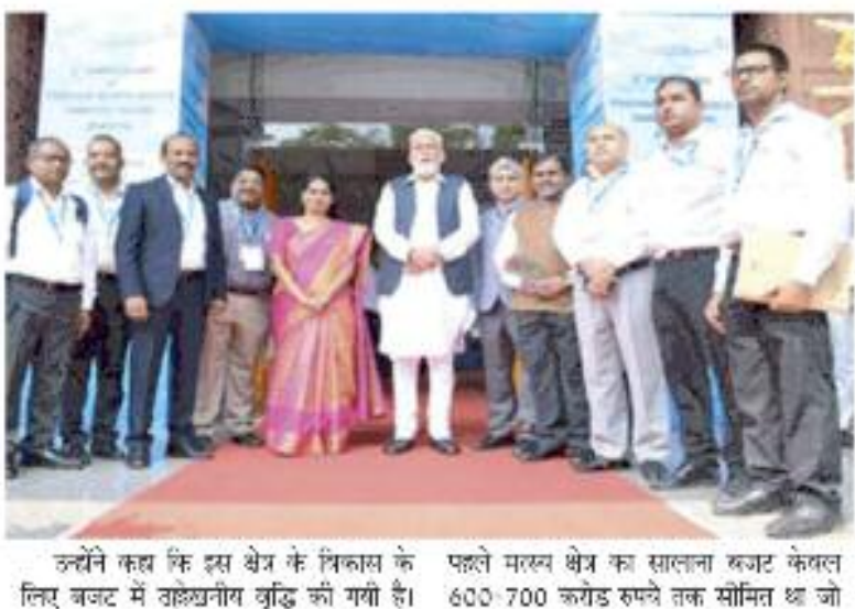
उन्होंने कहा कि इस क्षेत्र के विकास के लक्ष्य नजर में रहते हुए मत्स्य क्षेत्र का सालाना बजट केवल 600-700 करोड़ रुपये तक सीमित था जो

नयी दिल्ली ,11 सितंबर 2022। केन्द्रीय मत्स्य पालन मंत्री परशील रूपाला ने कहा कि मत्स्य क्षेत्र के विकास के लिए उनका विभाग प्रधानमंत्री नरेंद्र मोदी की सोच के अनुरूप निरंतर प्रयासरत है और निर्धारित लक्ष्यों को निश्चित रूप से हासिल किया जाएगा। श्री रूपाला ने प्रधानमंत्री पाल्य संपन्न योजना (पीएमएसएचवाई) के दो वर्ष पूरे होने के मौके पर यहां आयोजित कार्यक्रम में कहा कि देश में मत्स्य पालन, मत्स्य विभागन आदि में उल्लेखनीय वृद्धि हो रही है। उन्होंने कहा कि भारत के विश्व की पांचवी सबसे बड़ी अर्थव्यवस्था वाला देश बनने में मत्स्य क्षेत्र का भी योगदान है। सरकार ने 2025 तक भारत में सालाना दो करोड़ 20 लाख टन मछली उत्पादन का लक्ष्य निर्धारित किया है।