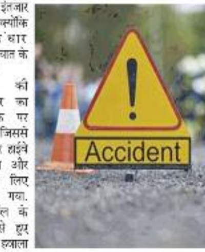
खुलने का इंतजार कर रहे हैं क्योंकि काबुल-कंधार राजमार्ग यातायात के लिए बंद है। रविवार की टुकड़ें टैंकर का ट्रेलर सड़क पर पलट गया, जिसमें काबुल-कंधार हाईवे पर यातायात और यात्रियों के लिए जाम लग गया, मीडिया पोर्टल के अनुसार फंसे हुए इकाइयों पर हवाला

काबुल , 11 सितम्बर 2022। दर्जनों टैंक और कारों टैंक ट्रेलर के दोनो ओर खड़े हैं, जो दक्षिणी अफगान प्रांत जाबुल में राजमार्ग पर गिर गया है, मीडिया रिपोर्टों में कहा गया है। यह तब आता है जब राजमार्गों पर यातायात, विशेष रूप से अफगानिस्तान के उत्तरी प्रांतों में यातायात दुर्घटनाओं में कई लोगों की मौत के साथ नातक यातायात दुर्घटनाओं का दृश्य बना गया है। अफगानिस्तान के स्थानीय मीडिया आउटलेट खामा प्रेस ने स्थानीय तालिबान अधिकारियों के हवाले से बताया कि ये सभी राजमार्ग के