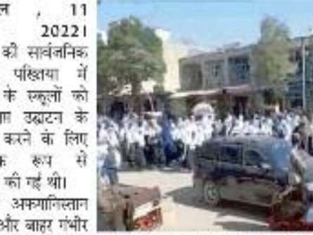
पर जाग्रत हो गए और अफगान जनता के साथ-साथ प्रसिद्ध राजनेताओं और मानवाधिकार रक्षकों द्वारा कई प्रतिक्रियाएं दी गईं। अफगानिस्तान सरकार ने कहा, -शिखा के अधिकार के लिए अफगान लड़कियों/महिलाओं को लड़ाई पूरी मानवता के लिए महत्वपूर्ण है क्योंकि

काबुल , 11 सितम्बर 2022। तालिबान की सार्वजनिक रूप से पकिया में लड़कियों के स्कूलों को एक महीना उद्घाटन के बाद बंद करने के लिए सार्वजनिक रूप से आलोचना की गई थी। इसकी अफगानिस्तान के अंदर और बाहर गंभीर प्रतिक्रियाएं हुईं। दोनो यूएन की रिपोर्ट के अनुसार, शांतिवादी दर्जनों लड़कियों ने अपने स्कूलों को