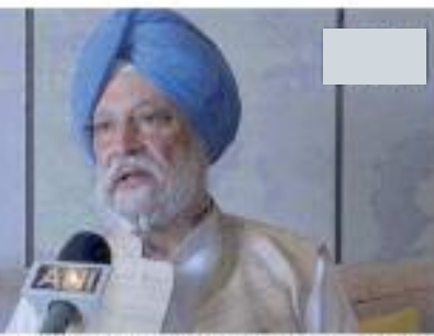
गैसोलीन की कीमतों में 2.12 प्रतिशत की कमी आई है। इस वर्षाधि के दौरान सभी प्रमुख व्यापारिक केंद्रों की गैस की कीमतों में भारी वृद्धि देखी गई है।

नई दिल्ली 11 सितंबर 2022। भारत ने वैश्विक ऊर्जा संकट का सामना करने में बहुत लचीलापन दिखाया है, केंद्रीय पेट्रोलियम और प्राकृतिक गैस मंत्री, हरदीप सिंह पुरी ने कहा कि सरकार को अतिरिक्त को कम करने और काम करने के उपायों को जोड़ना पड़ा है। एक मीडिया कार्यक्रम में ईंधन की कीमतों के बारे में बोलते हुए, मंत्री पुरी ने कहा कि भारत में कीमतों को विकसित देशों में तेजी से वृद्धि की तुलना में नियंत्रित किया गया है। अधिकांश विकसित देशों ने पेट्रोल की कीमतों में मजबूतपूर्ण मुद्रास्फूर्ति वृद्धि देखी है - जुलाई 2021 से अगस्त 2022 तक लगभग 40 प्रतिशत की वृद्धि। भारत में,