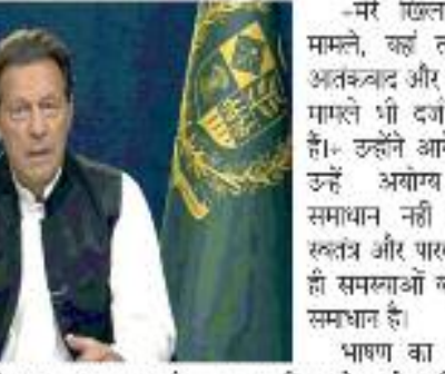
उन्होंने कहा, 'अगर वे स्वतंत्र और निष्पक्ष चुनाव नहीं कराते हैं, तो लोग शांतिपूर्व विरोध प्रदर्शन करने के लिए सड़कों पर जाने को तैयार हैं या हम जबरदस्ती चुनाव कराएंगे।- हम देख सकते हैं कि वे चुनाव में भाग रहे हैं क्योंकि वे जानते हैं कि वे पहले

इस्लामाबाद , 11 सितम्बर 2022। एक स्वतंत्र और निष्पक्ष चुनाव की मांग करते हुए पूर्व पाकिस्तानी प्रधानमंत्री इमरान खान ने कहा कि वह जेल जाने से इतर नहीं हैं और अगर सरकार मुक्त करने के लिए मजबूर करने में सफल होगी है तो वे जबरन चुनाव कराएंगे। और निष्पक्ष चुनाव, मीडिया रिपोर्टों में कहा गया है। पाकिस्तान के स्थानीय मीडिया आउटलेट द न्यू इंटरनेशनल की रिपोर्ट के अनुसार, शांतिवादी अपनी पार्टी के इस्माफ स्टूडेंट फेडरेशन एंड यूथ की एक संभोगन के दौरान प्रधानमंत्री शहबाज शरीफ के नेतृत्व वाली सत्तारूढ़ सरकार पर कटाक्ष करते हुए स्वतंत्र और निष्पक्ष चुनाव की अपनी मांग दोहराई। जिन्ना स्टैडियम में इमरान खान उन्होंने कहा, 'अगर वे स्वतंत्र और निष्पक्ष चुनाव नहीं कराते हैं, तो लोग शांतिपूर्व विरोध प्रदर्शन करने के लिए सड़कों पर जाने को तैयार हैं या हम जबरदस्ती चुनाव कराएंगे।- हम देख सकते हैं कि वे चुनाव में भाग रहे हैं क्योंकि वे जानते हैं कि वे पहले