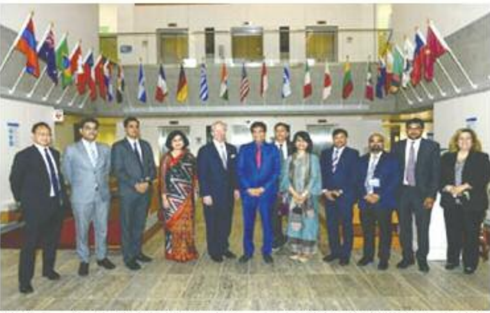
गोयल और बिटेन के साथ एफटीए वातावरण में आरंभिक समय में ऑस्ट्रेलिया और यूएस (संयुक्त अरब अमीरात) के साथ एफटीए संपन्न किया।

नयी दिल्ली ,11 सितंबर 2022। वाणिज्य और उद्योग मंत्री गोपाल गोयल ने अमेरिका की सरकारी यात्रा के दौरान कहा कि इस वर्ष पहले ही दो देशों के साथ मुक्त व्यापार समझौतों (एफटीए) को अंतिम रूप दे दिया गया है और साल के अंत तक ऐसे कम से कम दो और समझौतों पर हस्ताक्षर किए जा सकते हैं। गोयल लॉस एंजिल्स में यूएस-इंडिया स्ट्रेटिजिक पार्टनरशिप फोरम द्वारा आयोजित कार्यक्रम को संबोधित कर रहे थे। वाणिज्य एवं उद्योग मंत्रालय द्वारा आज जारी एक आधिकारिक बयान में कहा गया है कि श्री गोयल ने भारत में अधिक वृद्धि की उभरती नयी संधानाओं का उद्घेष्ट करते हुए कहा, इस साल दो एफटीए को पहले ही अंतिम रूप दे दिया गया है, और साल के अंत तक कम से कम दो और एफटीए वातावरणों को पूरा किए जाने की उम्मीद है।