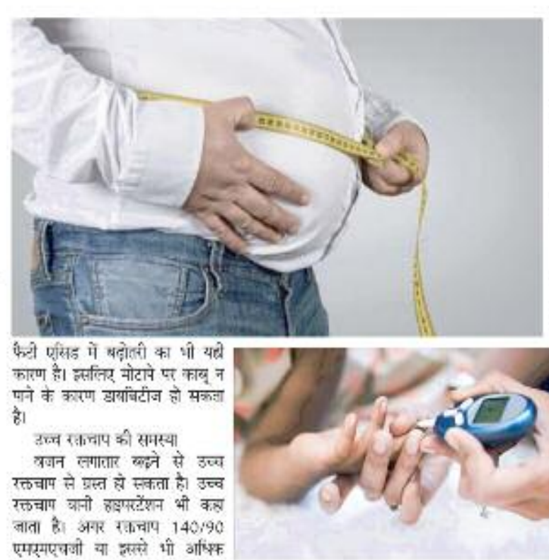
फैटी एसिड में बढ़ोतरी का भी यही कारण है। इसलिए मोटापे पर कायू न पाने के कारण डायबिटीज हो सकता है। उच्च रक्तचाप की समस्या वजन लगातार बढ़ने से उच्च रक्तचाप से ग्रस्त हो सकता है। उच्च रक्तचाप जानी हृदयरोग भी कह जाता है। अगर रक्तचाप 140/90 एमएमएचजी या इतले भी अधिक

कोरोना काल से लोगों में अपनी सेहत को लेकर सतर्कता बढ़ी है। हालांकि सेहत पर ध्यान न देने के कारण वजन बढ़ने और मोटापे से ग्रस्त होने जैसी समस्याएं भी बढ़ीं। मोटापा कई रोगों की वजह होता है। शरीर का वजन बढ़ना संपूर्ण सेहत के लिए नुकसानदायक है। इसके अलावा मोटापा शारीरिक और मानसिक रूप से नकारात्मक असर डालता है। वजन बढ़ने की वजह से मानसिक कम्पोजी होने के साथ ही कई मागे शारीरिक बीमारियां हो सकती हैं। मोटापे को दूर करने के लिए लोग डाइटिंग करने लगते हैं। घंटो कर्कअउट करते हैं। लेकिन मोटापे को कंट्रोल करने और वजन कम करने के लिए डाइटिंग और कर्कअउट भी शरीर को नुकसान पहुंचा सकती है। चलिए जानते हैं मोटापे से होने वाली बीमारियों के बारे में। डायबिटीज का खतरा मोटापे के कारण डायबिटीज की समस्या हो सकती है। शरीर में ब्लड ग्लूकोज का सामान्य स्तर 70 से 120 मिलीग्राम/डिएल से अधिक नहीं होना चाहिए। कई बार मोटापे के कारण ब्लड ग्लूकोज का लेवल बढ़ने से टाइप 2 डायबिटीज होने का खतरा रहता है। ओपेसिटी