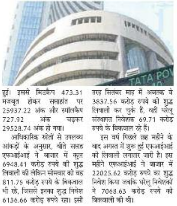
इसमें मिडकेप 473.31 मजबूत होकर सप्ताह पर 25937.22 अंक और स्मॉलकैप 727.92 अंक बढ़कर 29528.74 अंक हो गया।

मुंबई ,11 सितंबर 2022। वैश्विक स्तर पर महंगाई को नियंत्रित करने के लिए व्याज दरों में हो रही बढ़ोतरी के दबाव के बावजूद विदेशी संस्थागत निवेशकों (एफआईआई) की जरूरतसहिवाली और वकचके तेल की कीमतों में कमी की वरीलत बीते सप्ताह 1.7 प्रतिशत की छलांग लगा चुके परंतु शेयर बाजार में यदि एफआईआई का निवेश जारी रहा तो सेंसेक्स और निफ्टी जल्द ही नई ऊंचाई को छुएंगी। बीते सप्ताह बीएसई का वीएन शेयरों वाला संवेद सूचकांक सेंसेक्स 999.81 अंक की छलांग लगाकर सप्ताह पर 59793.14 अंक और नेशनल स्टॉक एक्सचेंज (एनएसई) का निफ्टी 293.9 अंक की तेजी के साथ 17833.35 अंक पर रहा। इस दौरान बीएसई की दण्ड कर्षणों की तरह मशीनें और छोटी कंपनियों में भी लिवालों