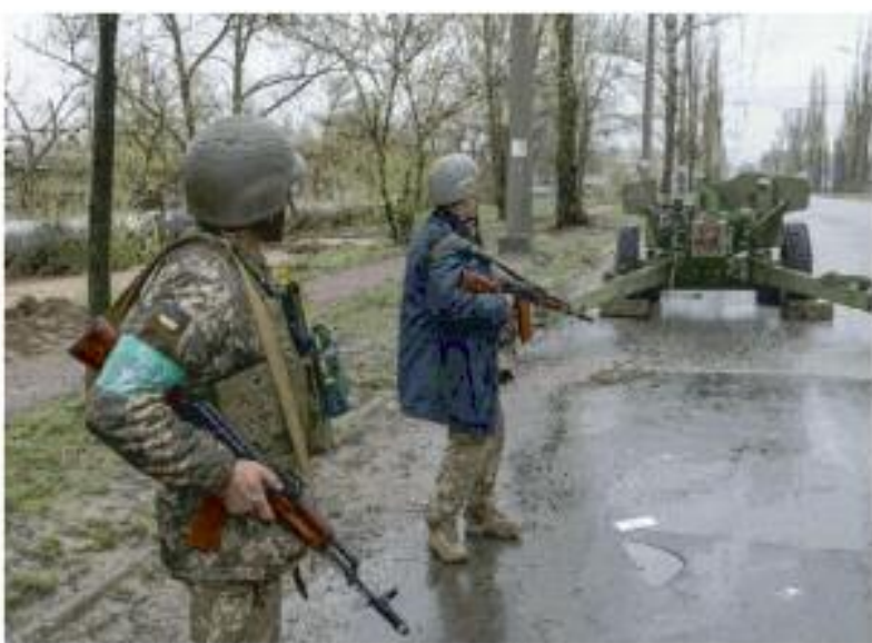
। एक और मुक्त संप्रदाय! प्रिंस रोमन द ग्रेट के नाम पर 14 वीं अलग मशीनगन ब्रिगेड के लिए धन्यवाद, यूक्रेनी छात्र चाकरोवस्की, खाकी बनाम क्षेत्र में लौट आया, - नेलेस्की ने कहा। युद्धकारी की दोर रात अपने दैनिक वीडियो सदस्य में, जेलेव्स्की ने कहा कि यूक्रेन के सशस्त्र बलों ने खाकी बनाम क्षेत्र में 30 से अधिक बस्तियों को मुक्त और निवृत्त कर

कीव , 11 सितम्बर 2022। रूस और यूक्रेन के बीच युद्ध एक नए चरण में प्रवेश करता प्रतीत होता है, जब कीव ने पूर्व के कुछ हिस्सों पर मारको की फाइंड की एक तेज गति से आक्रामक हमले के साथ एक बड़ा इटका दिया, जिसमें यूक्रेनी सैनिकों ने प्रवेश किया। इट महीने के कब्जे के बाद रणनीतिक शहर इज़ियम। जब यूक्रेन की सेना ने शनिवार को इज़ियम शहर में प्रवेश किया, तो यह एक महत्वपूर्ण मैनु जित से कर्तौ अधिक था। सीएनएन की रिपोर्ट के अनुसार, यह इस बात का संकेत था कि रूसी सैनिकों के खिलाफ हमलों में अपने कब्जे वाले क्षेत्र पर कब्जा करने के लिए हथ-पांव मार रहे हैं। यूक्रेनी बलों द्वारा खाकी बनाम क्षेत्र के माध्यम से पूर्व की ओर एक नया आक्रमण शुरू करने के ठीक पांच दिन बाद रूसी सेना को रणनीतिक पूर्वी शहर को खाली करने के लिए मजबूर किया गया था। यूक्रेन के भूमि बलों के योहन ब्रिगेड के एक प्रवक्ता ने शनिवार दोपहर एक बयान में कहा, 'रूसी भाग गए और इथियार और बास्कर पीछे छोड़ गए। शहर का केंद्र मुक्त है।- रणनीति बलवाईर जोर्जेव्सकी ने रविवार को टेलीग्राम पर कहा कि यूक्रेन की सेना ने खाकी बनाम रूसी सैनिकों के क्षेत्र में चाकरोवस्की की बस्ती को मुक्त कर लिया है