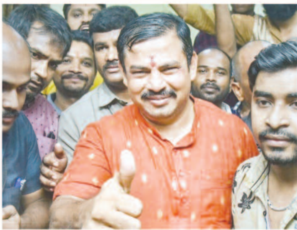
कुछ दिनों से लगातार विरोध प्रदर्शन जारी है। पुलिस ने बुधवार को लाठीचार्ज भी किया था ताकि भीड़ को तितर-बितर किया जा सके।

बुधवार रात को भी हजारों की भीड़ हैदराबाद की सड़कों पर उतरी थी और सिर तन से जुद्ध के नारे लगाते हुए टी. राजा सिंह के खिलाफ प्रदर्शन की मांग की थी। हैदराबाद के कई इलाकों में बीते