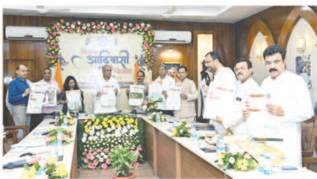
मुख्यमंत्री भूपेश बघेल ने सामुदायिक वन संसाधन अधिकार जागरूकता अभियान का शुभारंभ किया।

सभाओं में अभी भी सूचनाएं और प्रक्रियाएं पहुंच नहीं पा रही थीं। अब पुनः मुख्यमंत्री ने समीक्षा की और ग्राम सभाओं को जागरूक करने के लिए एक विशेष अभियान की आवश्यकता महसूस की। इसे ध्यान में रखते हुए फाउंडेशन फॉर इकोलॉजिकल सिस्तेमेटिक्स ने आदिवासी विकास विभाग और वन विभाग के मार्गदर्शन में ग्राम सभाओं को प्रक्रियाओं की जानकारी देने सामुदायिक वन संसाधन अधिकार जागरूकता अभियान का एक कैलेंडर तैयार किया। इसका शुभारंभ 9 अगस्त को मुख्यमंत्री भूपेश बघेल ने किया। यह अभियान 15 अगस्त 2022 से 26 जनवरी