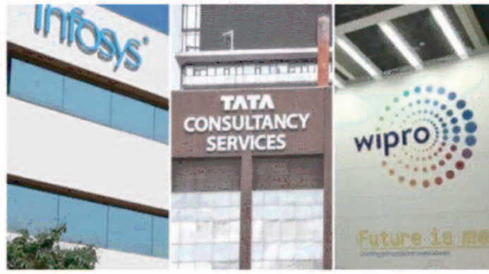
उसका परिणाम मिलने लगा है। विप्रो के सीईओ और एमडी ने कहा है कि हमने