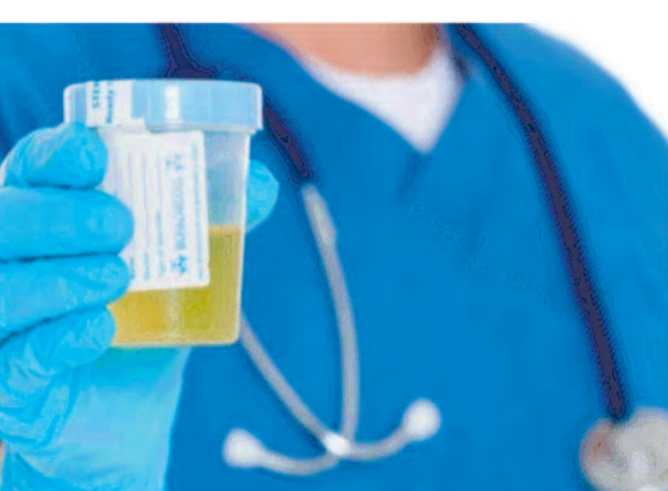
रहे हैं। हालांकि कुछ स्थितियों में इसे लिवर की कई तरह की समस्याओं

है। इसी तरह से अलग-अलग तरह की बीमारियों में पेशाब के रंग में बदलाव देखा जा सकता है। कुछ स्थितियों में पेशाब का रंग काला, लाल, गुलाबी भी हो सकता है, इस तरह के रंग कई प्रकार की शारीरिक समस्याओं का संकेत हो सकते हैं। आइए जानते हैं कि पेशाब के रंग के आधार पर किस प्रकार से शरीर की समस्याओं का अंदाजा लगाया जा सकता है? साफ रंग का पेशाब पेशाब का रंग सामान्यतौर पर साफ रहता है, यह संकेत है कि आप अधिक पानी पी