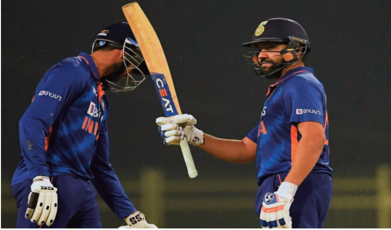
जबकि विराट कोहली और ऋषभ पंत उन खिलाड़ियों में शामिल हैं जिन्हें विश्राम दिया गया है।

नियमित कप्तान रोहित शर्मा की अनुपस्थिति में शिखर धवन को त्रिनिदाद के पोर्ट ऑफ स्पेन में 22 जुलाई से वेस्टइंडीज के खिलाफ शुरू होने वाली तीन मैचों की वनडे श्रृंखला के लिये बुधवार को भारतीय टीम का कप्तान चुना गया