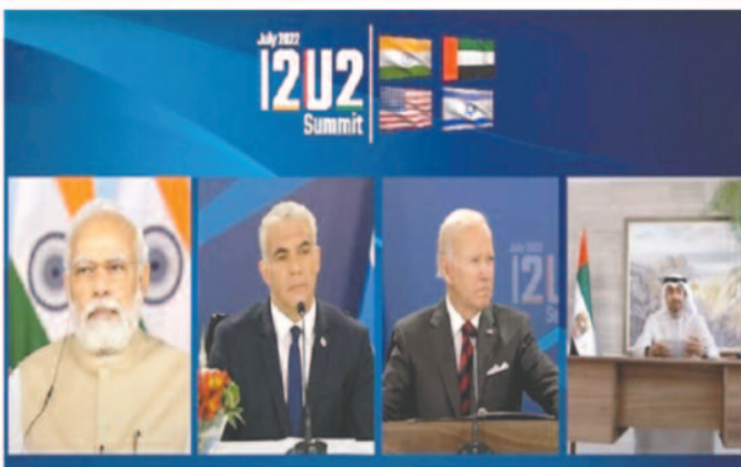
33 करोड़ डालर उपलब्ध कराएगी। चारों देशों की तरफ से और अमेरिका के राष्ट्रपति जो बाइडन ने

इसी तरह से एक दूसरा फैसला किया गया है कि गुजरात में रिनीवेबल ऊर्जा (सोलर व पवन) से 300 मेगावाट का बैटरी स्टोरेज सिस्टम स्थापित किया जाएगा। इस पर संभाव्यता अध्ययन के लिए अमेरिका की ट्रेड व डेवलपमेंट एजेंसी