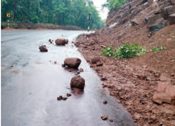
राष्ट्रीय राज्य मार्ग 43 पर लुढ़कते पत्थरों का खतरा चलते वाहनों पर कभी भी गिर सकते हैं मोटे झाड़ और बड़ी चट्टाने

जो बड़ी संभावित दुर्घटना का कारण छोड़ गई उसका परिणाम कभी भी भयावह हो सकता।