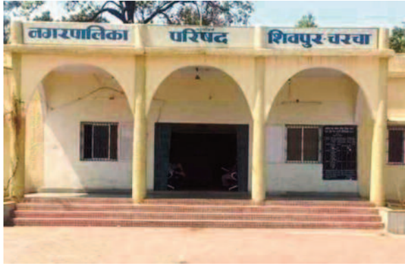
शिवपुर चरचा नगरपालिका परिषद