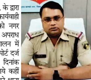
आरोपी एलीन मसीह के साथ सूरत गुजरात में रहे थे डू आज परसाभाटा बालकों में आये है की

था। अपहृता की पता तलाश के दौरान दिनांक 07.07.2022 को अपहृता नाबालिक लड़की