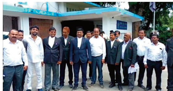
आरोप है कि इसी बीच थाना प्रभारी का बातचीत करने का लहजा बदल गया और उन्होंने अधिवक्ता के थाना आने पर

-नगर संवाददाता- अम्बिकापुर, 08 जुलाई 2022(घटती-घटना)। आम जनता से अच्छा संबंध बनाने की पुलिस अधीक्षक द्वारा दी गई नसीहत पर कितना अमल उनके अधीनस्थ कर रहे हैं, यह अधिवक्ताओं के भड़के आक्रोश से सामने आ रहा है। महिला थाने में एक अधिवक्ता के साथ महिला थाना प्रभारी द्वारा किए गए दुर्व्यवहार की जानकारी अधिवक्ता संघ तक पहुंची और प्रतिनिधिमंडल अधिवक्ता संघ के