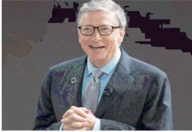
गेट्स ने खुद अपना 48 साल पुराना रेज्यूमे सोशल मीडिया पर शेयर किया

आपको बता दें कि माइक्रोसॉफ्ट के मुखिया ने अपना जो बायोडेटा या रेज्यूमे सोशल मीडिया पर शेयर किया है उसके अनुसार उन्होंने सिस्टम स्ट्रक्टर, डेटाबेस मैनेजमेंट, कंप्यूटर ग्राफिक्स से जुड़े कोर्स किए थे। जब माइक्रोसॉफ्ट के मुखिया बिल गेट्स ने खुद अपना 48 साल पुराना रेज्यूमे सोशल मीडिया पर शेयर किया