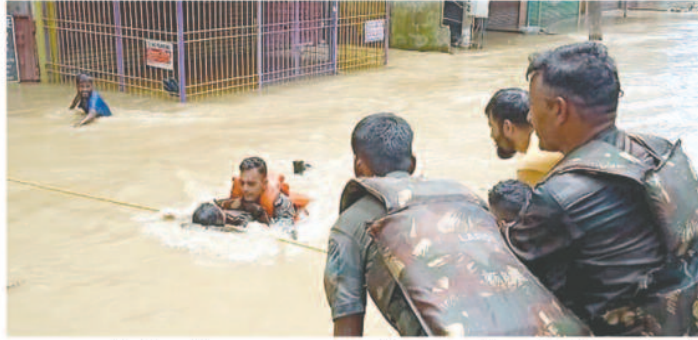
शहर का हवाई सर्वेक्षण किया।

आईएमसीटी की एक टीम कछार, हैलाकांडी और करीमगंज और दूसरा समूह नलबाड़ी, बजली, कामरूप और मोरीगांव में बाढ़ से हुए नुकसान का आकलन करने वाला है। मुख्यमंत्री हेमंत विश्व शर्मा पिछले दस दिनों में बराक घाटी का तीसरी बार दौरा किया और वहां की स्थिति की समीक्षा करने के लिए करीमगंज पहुंचे। उन्होंने जिले के सुभाष हाई स्कूल कालीबाड़ी और गोपिकानगर में राहत शिविर का दौरा किया। मुख्यमंत्री ने इससे पहले दो बार सिलचर का दौरा किया और जलमग्न